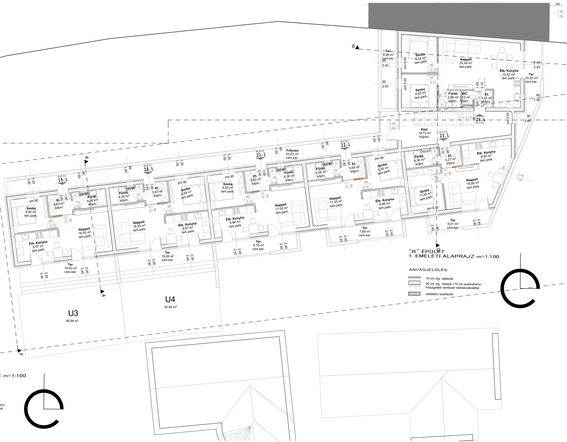
"B" ÉPÜLET 1. EMELETI ALAPRAJZ m=1:100